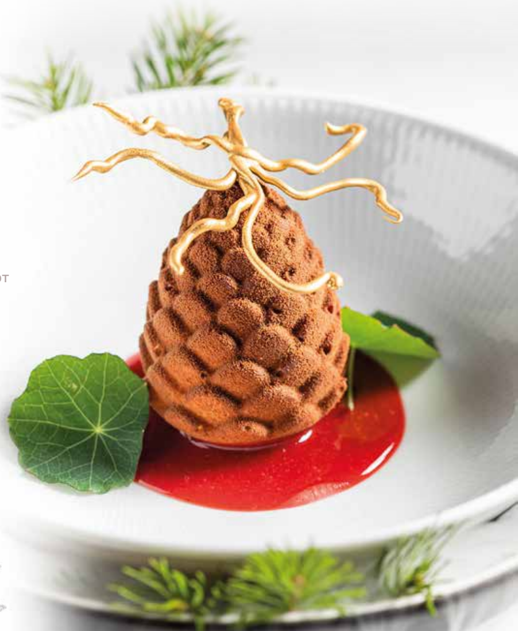
Фирменный десерт «Pallasa»