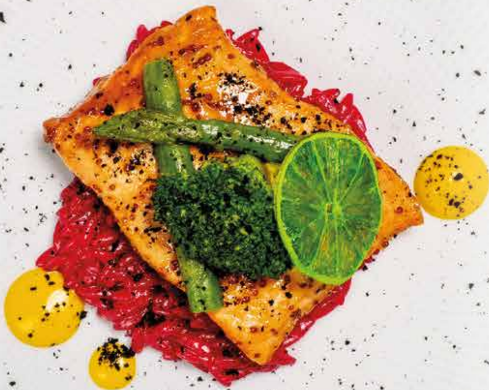
Лосось с орзо и горчично-медовым соусом