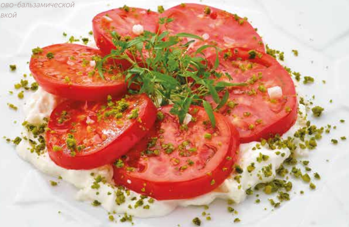
Томаты со страчателлой и медово-бальзамической заправкой