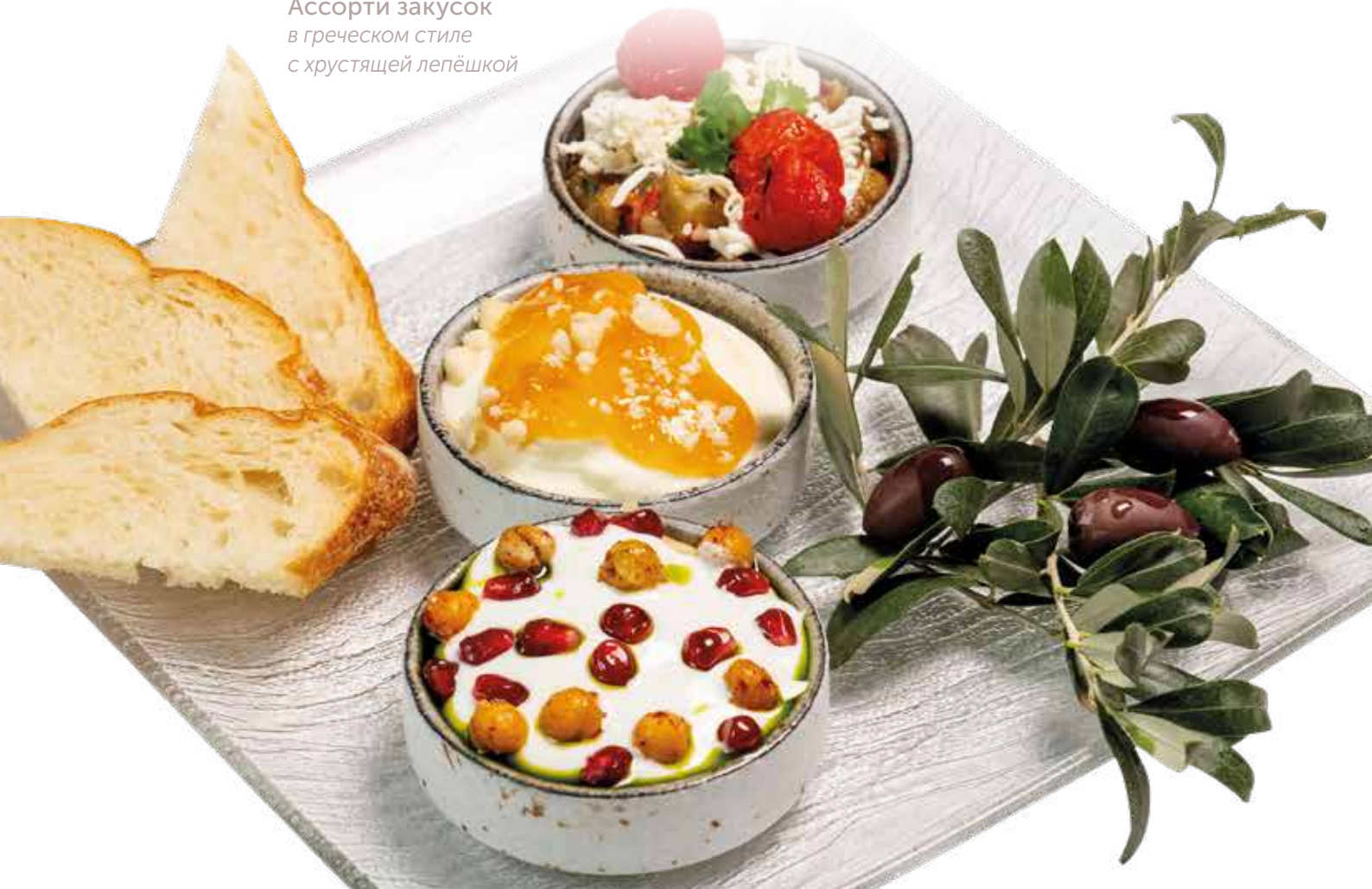
Ассорти закусок в греческом стиле с хрустящей лепёшкой